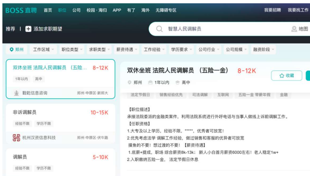
图 2 智慧人民调解员岗位网络调查