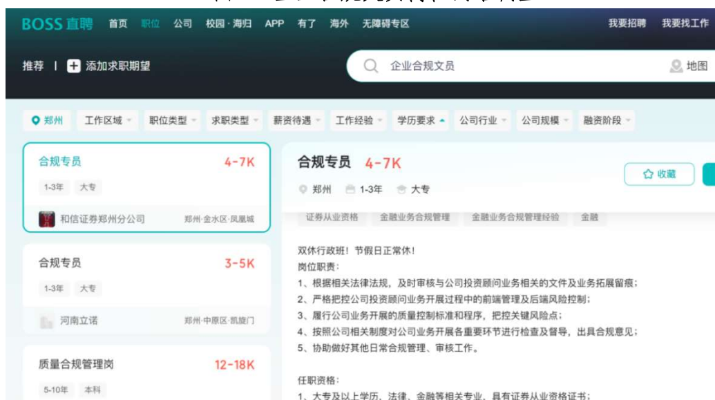
图3 企业合规文员岗位网络调查